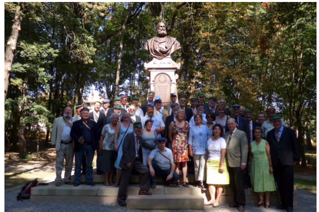
Delegation des Traditionsverbandes vor dem Tomaszczuk- Denkmal in Czernowitz