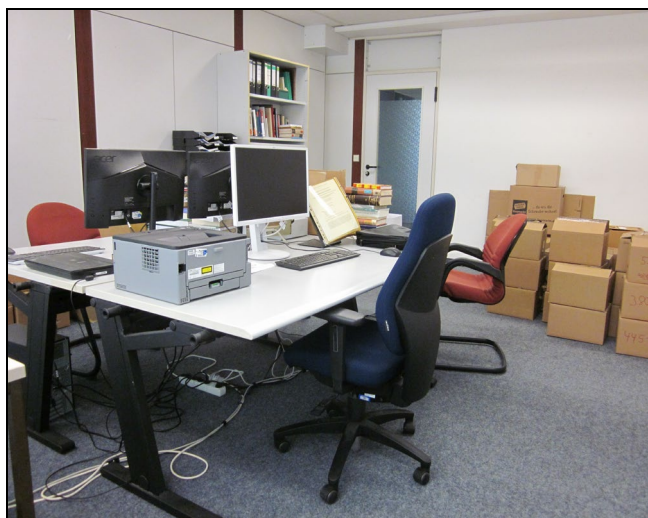
Zum Vergleich: Unser ehemaliges „IDS-Büro“, welches wir im Oktober 2024 aufgeben mussten.