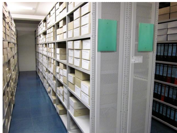
Blick in einen der Gänge mit Archivkartons.

tel zur Verfügung, mit deren Hilfe er sich das Gewünschte im Lesesaal des Stadt- und Kreisarchivs Paderborn vorlegen lassen kann. Eine persönliche Absprache ist zur Zeit empfehlenswert, weil nach dem Umzug die Einordnung einiger Teilbestände immer noch nicht vollständig abgeschlossen ist. Wann die aufwendigen Ordnungsarbeiten beendet sein werden, ist nicht abzusehen. Jedoch rückt die „normale“ Benutzbarkeit für die interessierte Öffentlichkeit Stück für Stück näher. Eine Möglichkeit zur Ausleihe außer Haus besteht nicht, weil unsererseits die erforderliche Arbeitskapazität fehlt.