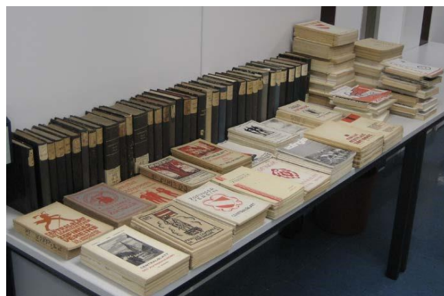
Ergänzungen zum Centralblatt des schweizerischen Zofingervereins von Dr. Paul Ehinger.

Auch in Zukunft werden die knappen zur Verfügung stehenden finanziellen Mittel nur für einzelne wichtige Anschaffungen zur Verfügung stehen. Erfreulicherweise springen vielfach großzügige Mitglieder der GDS ein, so daß die wichtigste Literatur dennoch zur Verfügung steht.