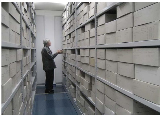
In einem Regalgang des IDS mit Kartons der Archivalien und Sachzeugnisse.

Archivalien, Broschüren, Flugzetteln, Zeitungsausschnitten, Kleinschrifttum und Sachzeugnissen. Die hierbei entwickelte und fortlaufend ergänzte Systematik gilt für sämtliche Bereiche, neuerdings auch für die digitalen Medien.