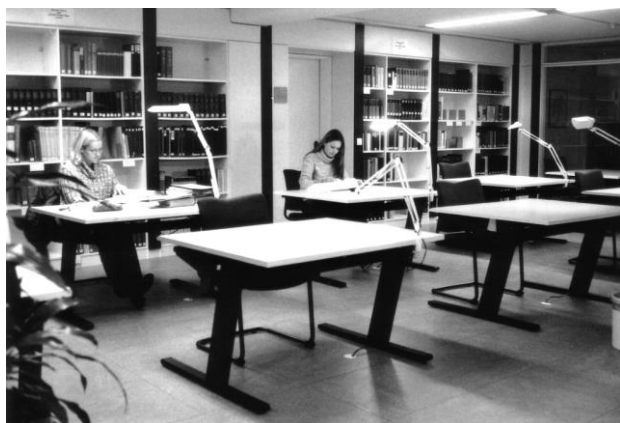
Blick in den Lesesaal des Stadtarchivs.

Zu dieser Bibliothek gehören auch die zentral aufgestellten Teile der Verwaltungsbibliothek der Stadtverwaltung, wie etwa Gesetz-, Verordnungs- und Ministerialblätter und Verwaltungsfachzeitschriften.