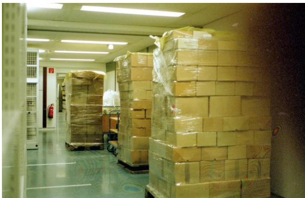
Die ersten Paletten mit unseren Sammlungen treffen ein...