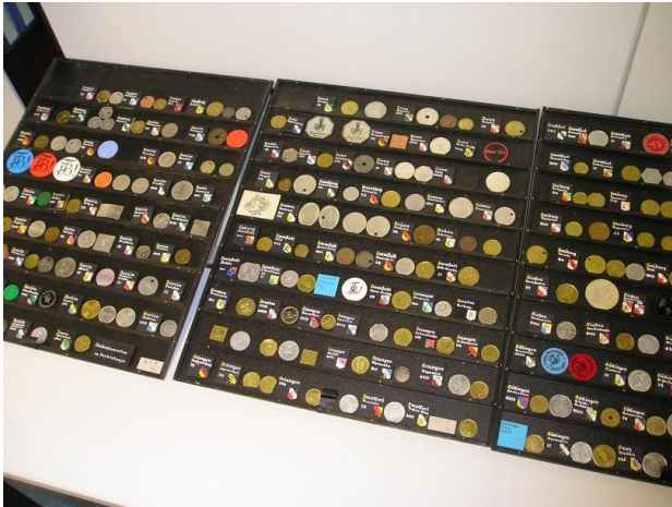
Beispiel für eine Sammlung: Ein Teil der „Zerbes-Sammlung“ studentischer Wertmarken.