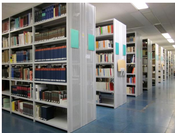
Blick in unser Magazin.