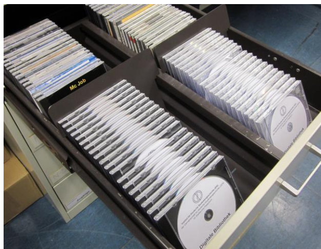
Sicherheitskopien unserer Digitalisate auf DVDs

Einen vergleichbaren Einspareffekt haben wir bei unserer „Aufsatzsammlung“ erzielt. Lange Zeit haben wir verstreute Aufsätze abgelichtet und binden lassen. Seit dem 168. Band digitalisieren wir statt dessen und sparen Regalmeter um Regalmeter an Stellfläche. Mit der Digitalisierung haben wir Anfang 2017 begonnen. Inzwischen sind rund 10.300 Digitalisate vom Flugblatt bis zum Lexikon gespeichert und in Verzeichnissen erfaßt. Zusätzlich wurden 3500 Couleurekarten mit Vorder- und Rückseite digitalisiert. Unabhängig von der Digitalisierung wird die Bücherei mit den Monographien selbstverständlich wie bisher fortgeführt und laufend erweitert.