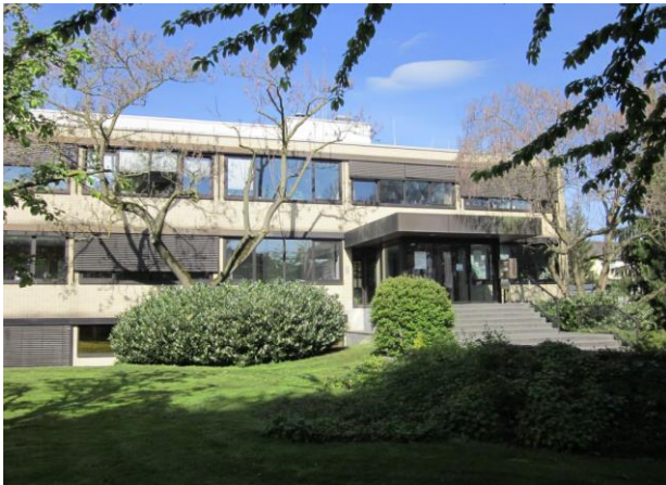
Das Technische Rathaus in Paderborn, in dem sich das Stadt- und Kreisarchiv befindet-

Das seit Anfang 2017 zusammengeschlossene Stadt- und Kreisarchiv Paderborn ist ein eigenständiges Amt im Kulturdezernat der Paderborner Stadtverwaltung. Es arbeitet auf der Basis des Gesetzes über die Sicherung und Nutzung öffentlichen Archivgutes im Lande Nordrhein-Westfalen (Archivgesetz NW) und hat, wie es in der Archiv-Dienstanweisung heißt, die Aufgabe, „Dokumente zur Geschichte der Stadt und des Kreises Paderborn zu sichern, zu übernehmen, zu verwahren, zu erschließen, zu erforschen, zu veröffentlichen oder sonst nutzbar zu machen und zur Wahrung der Rechte der Stadt und des Kreises Paderborn beizutragen“.