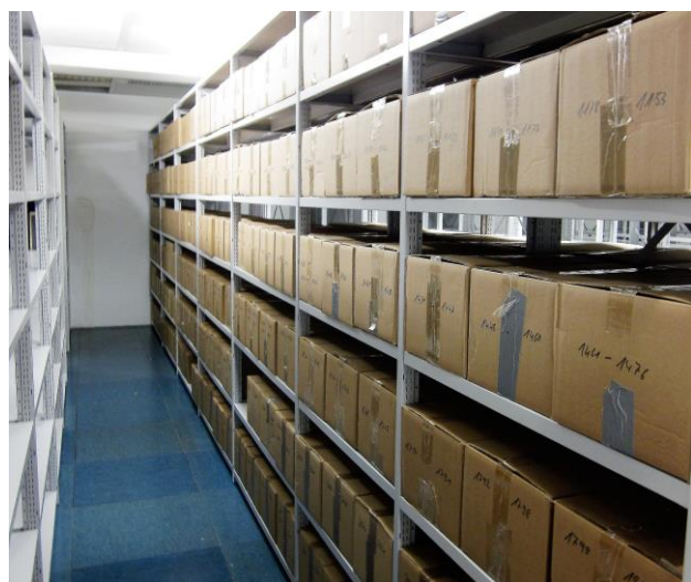
Eine besondere Bedeutung innerhalb des IDS hat die „Gladen-Bibliothek“, hier noch in den Transportkartons.