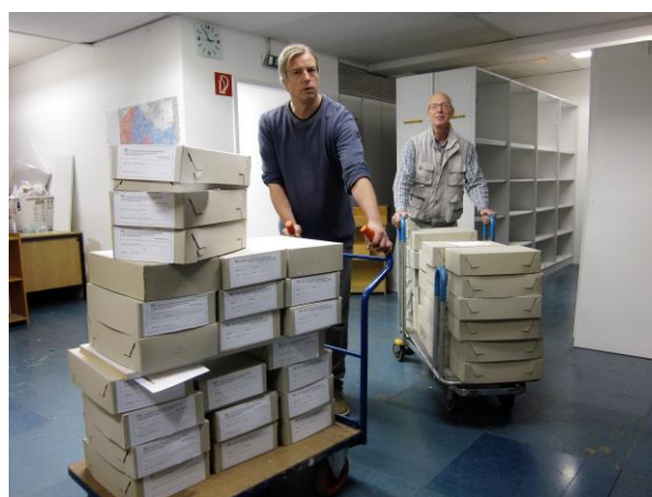
Die Firma Masching half beim Umzug.

Infolge vieler Erwerbungen und Zuwendungen waren die Stellflächen für das Institut im Stadt- und Kreisarchiv bald gänzlich ausgeschöpft. Im Jahre 2022 erfolgte daher ein aufwendiger Umzug in größere Räume innerhalb des Technischen Rathauses. Die IDS-Bestände waren inzwischen derartig angewachsen, daß die eigenen Kräfte für den Transport nicht mehr ausreichten und externe Hilfe notwendig wurde.