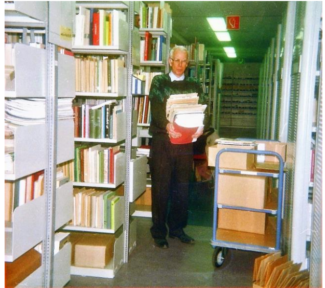
... und werden provisorisch in Regalen verstaut

Nach dem Umzug in die Räume des nunmehrigen Stadt- und Kreisarchivs im November 2001 wurde zunächst eine grobe Ordnung des Sammlungsgutes durchgeführt, indem Bücher, Zeitschriften, Drucksachen, Archivalien und Sachzeugnisse voneinander getrennt wurden. In einem weiteren Schritt wurden die Monographien nach der Regensburger Verbundklassifikation aufgestellt und Kleinschrifttum und Sachzeugnisse in Archivkartons verstaut.