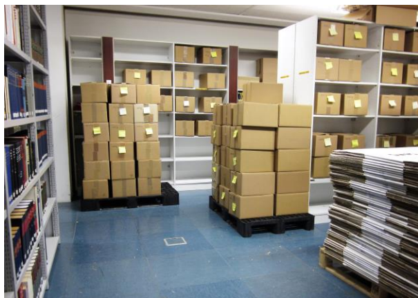
Wichtig beim Umzug war die Erhaltung der bestehenden Ordnung, damit keine unnötige Doppelarbeit entstehen würde.