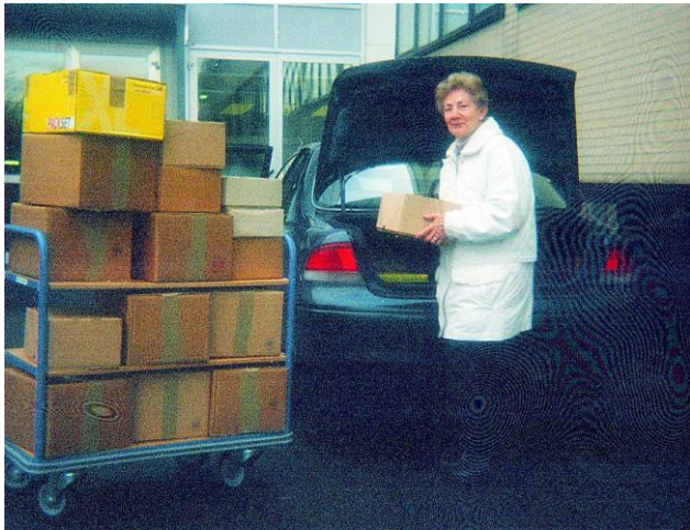
Der Transport zum Stadt- und Kreisarchiv beginnt

um etwa 3000 Monographien sowie Broschüren, Flugzettel, Akten und Sachzeugnisse. Mit der Stadt Paderborn wurde ein Depoitalvertrag abgeschlossen. Der inzwischen gebräuchliche gewordene Name „GDS-Institut für Studentengeschichte“ wurde ersetzt durch „Institut für Deutsche Studentengeschichte“ (IDS).