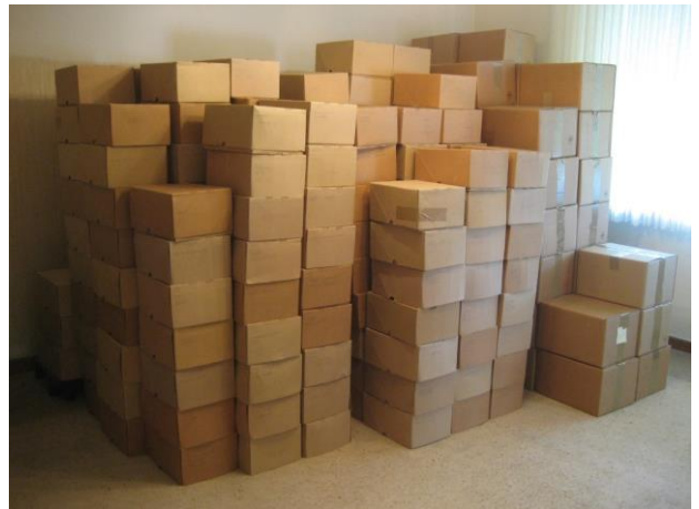
Eine der provisorischen Lagerstätten der IDS-Sammlungen in einer Wohnung in Paderborn

In den 1990er Jahren, als das Sammelgut der GDS weiter angewachsen war, begannen Überlegungen, die verstreuten Bestände dauerhaft zusammenzuführen und für Interessenten verfügbar zu machen. Versuche an mehreren Universitätsorten, darunter Würzburg, Greifswald und Jena, scheiterten nach teilweise erfolgversprechenden Anfängen.