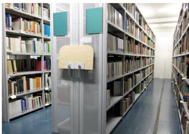
Die Regale an unserem neuen Standort fassen wesentlich mehr Bücher und Archivkartons als bisher.