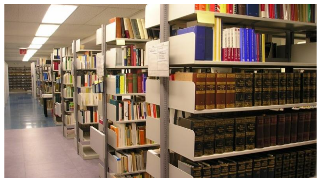
Die IDS-Bibliothek im Stadt- und Kreisarchiv Paderborn um das Jahr 2010.

Die Bücherei der GDS umfaßt sowohl im Buchhandel erhältliche oder erhältlich gewesene Werke, aber auch einen umfangreichen Bestand sogenannter grauer Literatur, d. h. von Druckerzeugnissen, die nur in kleiner Auflage für einen begrenzten Personenkreis erschienen sind und daher selten in einem öffentlichen Katalog zu finden sind.