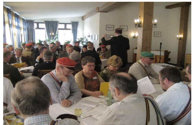
Liedgutseminar der GDS im Jahre 2008 in Stolpen.

Zunächst als Halbjahresschrift, heute als Quartalschrift, erscheint sodann der Studenten-Kurier als eine der maßgeblichen Zeitschriften für den Studentenhistoriker. Abgerundet wird die Veröffentlichungstätigkeit durch weitere Schriften, wovon besonders das Lexikon der CV- und ÖCV-Verbindungen zu nennen ist.