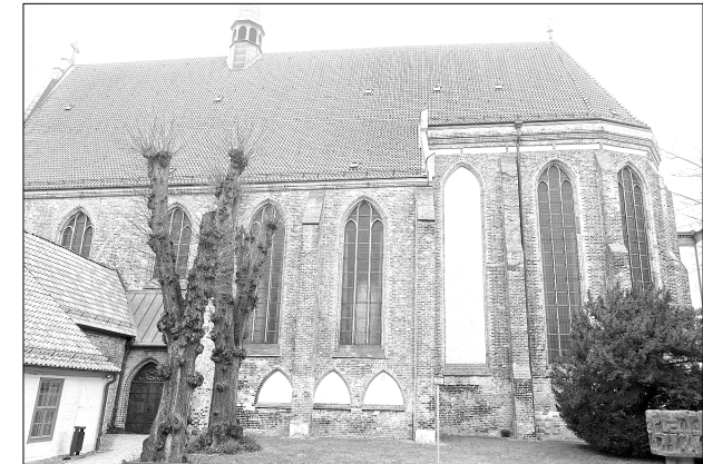
Kirche „Zum Heiligen Kreuz“, erbaut im 14. Jahrhundert für die Zisterzienserinnen, seit 1899 Universitätskirche