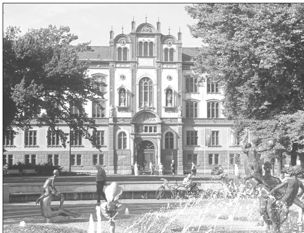
Das Hauptgebäude der Universität Rostock