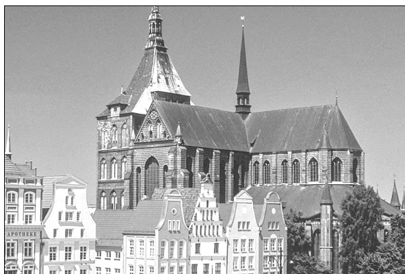
Ab 1419 Rostocks erste Universitätskirche: St. Marien