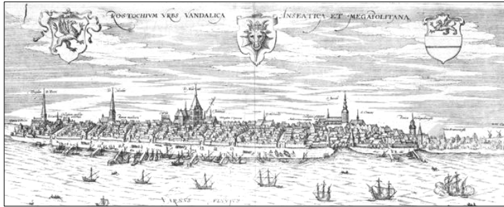
Rostock um 1700