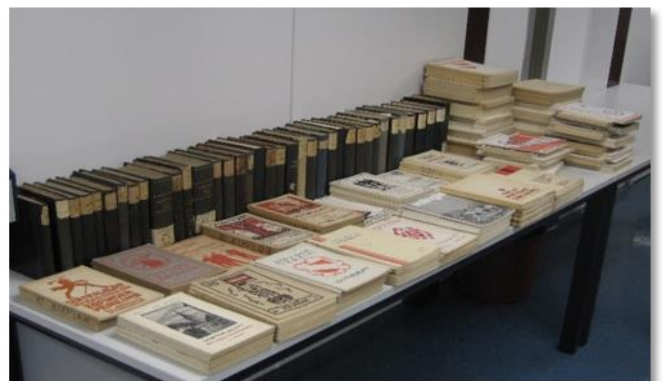
Dank der Zusendung konnten wir Lücken füllen und so unter anderem zahlreiche Jahrgänge des Zofingerblattes und der Studentica Helvetica vervollständigen.