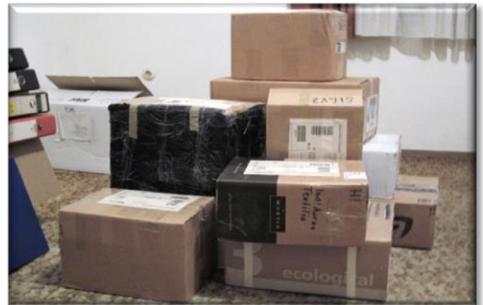
Das Bild zeigt die Kartons nach der Ankunft während der vorübergehenden Aufbewahrung in einer Privatwohnung (Golücke).